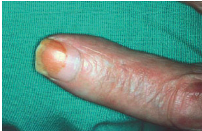
Abbildung Finger nach Nikotinentzug [Cornuz 2013]

Hier wird der Finger eines 67-jährigen Mannes gezeigt, der vor seinem Nikotinentzug 40 Zigaretten pro Tag geraucht hatte.