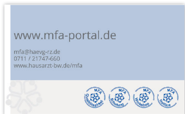
Abbildung 1 Fortbildungsausweis des Hausärzterverbands Baden-Württemberg