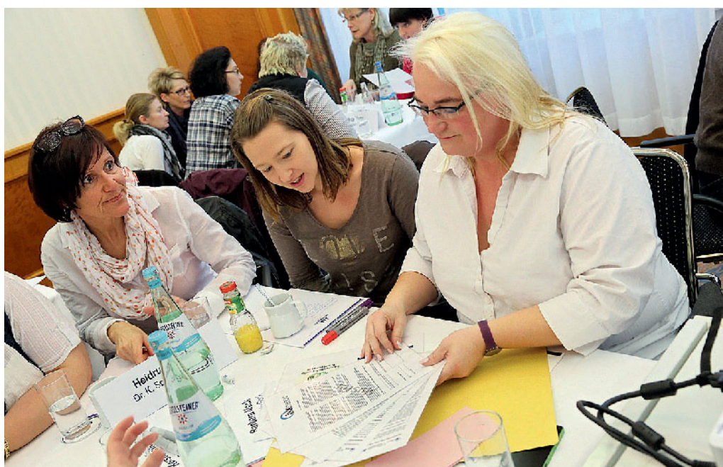
Abbildung 2 MFA-Workshop

Mit unserer „Hotline von MFAs für MFAs“ wollen wir den MFAs eine weitere Plattform bieten, um sich gezielt zu informieren und mit Kolleginnen auszutauschen. Die Hotline ist mit erfahrenen MFAs besetzt, die selbst in einer HZV-Praxis tätig sind und zusätzlich regelmäßig von uns zu aktuellen Themen rund um die Hausarztverträge geschult werden. Über unsere MFA-Hotline wollen wir Fragen beantworten, die sich aus dem täglichen Praxisalltag ergeben und die nicht mal eben während der laufenden Sprechstunde abgehandelt werden können bzw. einen intensiveren Beratungsbedarf be-