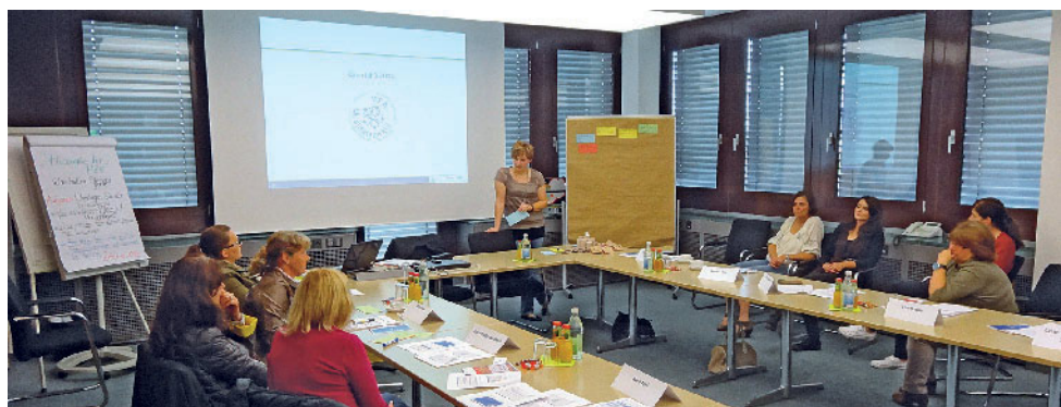
Abbildung 3 MFA-Qualitätszirkel

Unsere Veranstalter, z.B. unsere Qualitätszirkel-Moderatorinnen, werden von uns mit einem Scanner ausgestattet. Künftig wird bei jeder unserer Veranstaltungen der Barcode von den Fortbildungsausweisen der MFAs