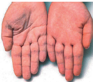
Abbildung 1 Von den beiden dargestellten Händen hat die (bildmäßig) linke Hand nicht mehr als drei Minuten unter Wasser gelegen.

Thomas JM, Durack A, Sterling A, Todd PM, Tomson N. Aquagenic wrinkling of the palms: a diagnostic clue to cystic fibrosis carrier status and non-classic disease. Lancet 2017; 389: 846