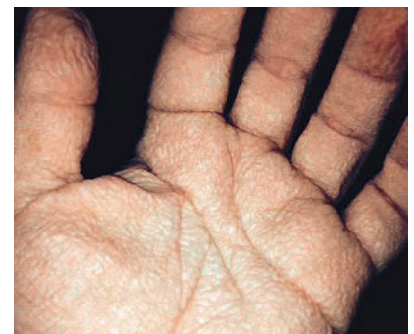
Abbildung 2 Unter ultraviolettem Licht sieht man das Waschfrauenhände-Phänomen noch intensiver: Faltenbildung und moderates Ödem